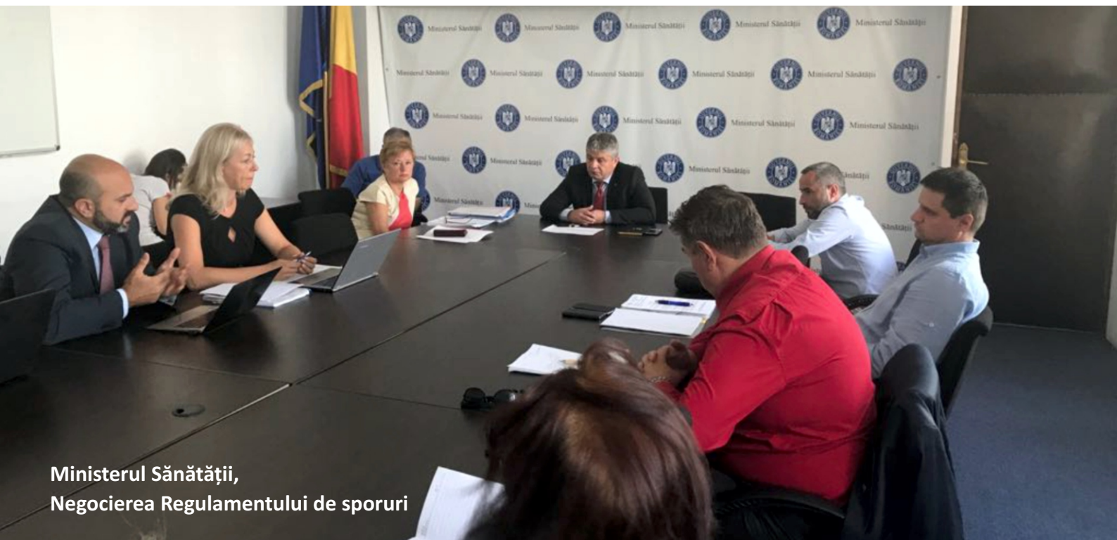
Ministerul Sănătății, Negocierea Regulamentului de sporuri

"Solidaritatea Sanitară" în cadrul ședinței de negociere din 04 septembrie, în caz contrar existând riscul mării acordării sporului pentru condiții de muncă prin acordarea acestuia la un nivel de 1%. Scopul limitei minime îl reprezintă inclusiv menținerea ierarhiei sporurilor, respectiv recompensarea condițiilor de muncă în funcție de clasificarea acestora, nefiind de acceptat, spre exemplu, ca un spor pentru condiții deosebit de periculoase să fie acordat sub limita unui spor pentru condiții periculoase sau vătămătoare.